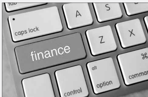
مصوبه صدور مجوز تامین ۱۵ درصد سهم کارفرما مربوط به فاینانس برای برخی

همچنین به موجب مصوبه دولت، صندوق توسعه ملی براساس درخواست سازمان برنامه و بودجه کشور نسبت به اختصاص اعتبار مورد نیاز برای تامین ۱۵ درصد پیش پرداخت طرحهای یاد شده اقدام خواهد کرد.