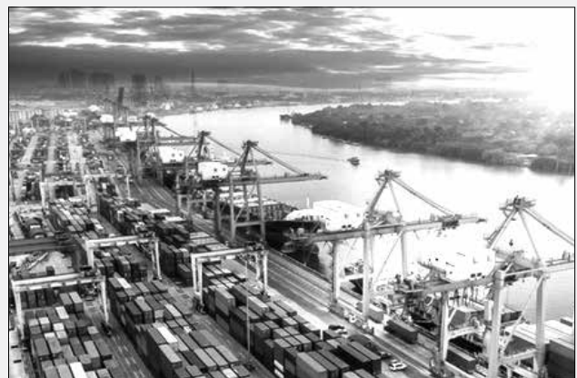
امکان ابطال ثبت سفارش در سامانه جامع تجارت فراهم گردیده است و از این پس